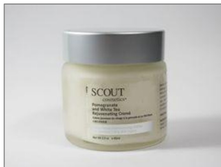
Crema rehidratante con granada