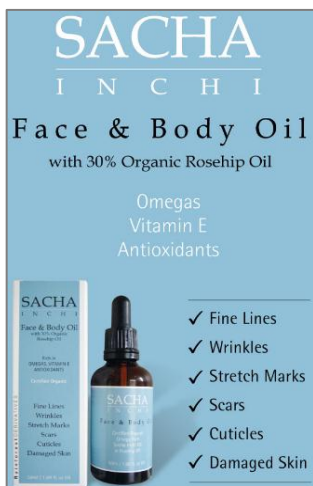
Aceite para el rostro y cuerpo con 70% de sachá inchi.