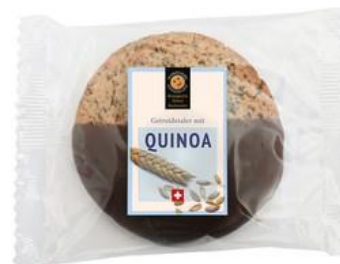
Galleta con chispas de chocolate, a base de harina de quinua y kiwicha www.reformhaus.ch