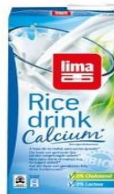
Leche de arroz, libre de gluten y fortificada con calcio. www.reformhaus.ch