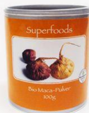
Polvo de maca orgánica Se recomienda consumirlo en las mañanas con los cereales, para brindar energías www.vita-shop.ch