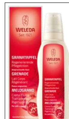
Crema de cuerpo regenerativa a base de granada. www.weleda.ch