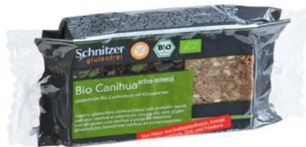
Pan a base de harina de cañihua www.reformhaus.ch