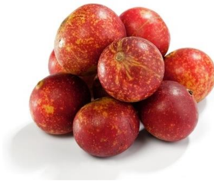
Gráfico N° 1 Camu Camu

A continuación, se detalla la partida arancelaria específica bajo la cual se importa este producto en Alemania. Según el portal Market Access Map (2017) se especifica lo siguiente: