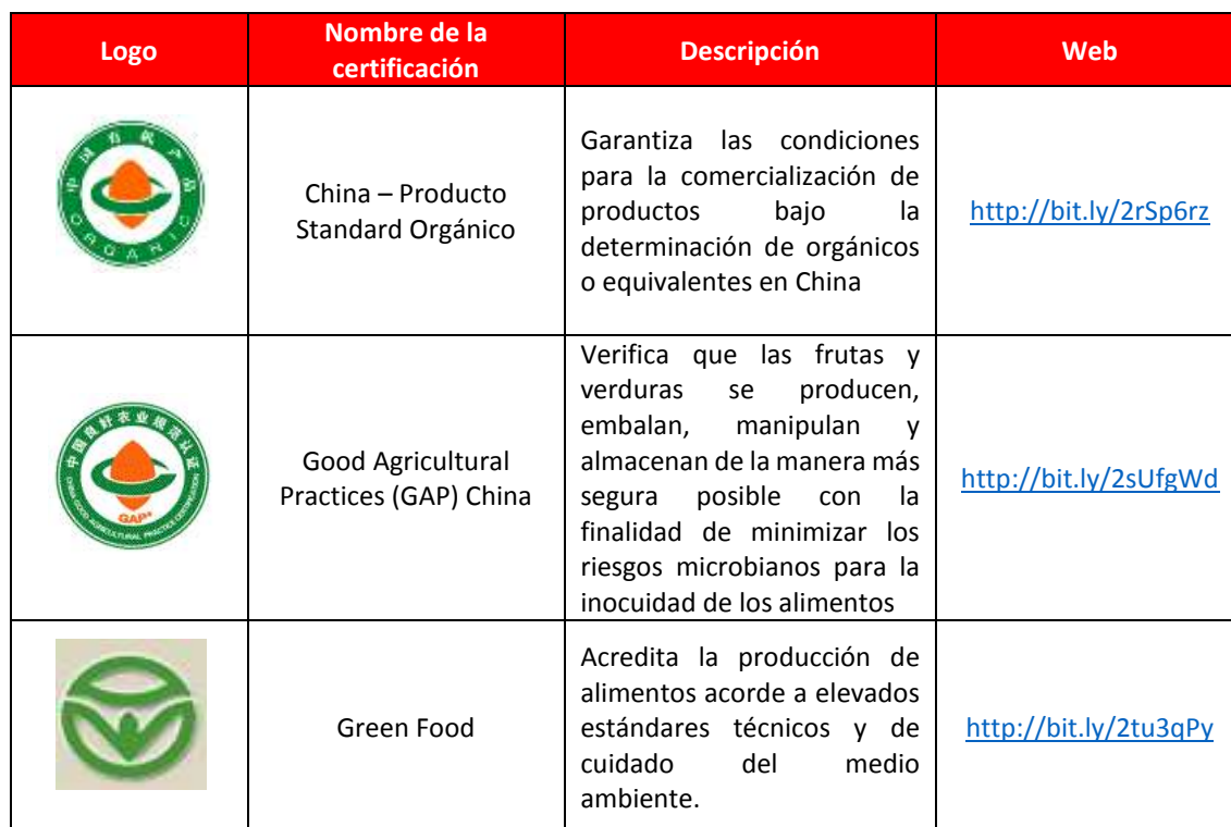
Cuadro N° 3 Certificaciones

Elaboración: Inteligencia de Mercados - PROMPERU