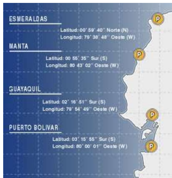
Gráfico 3: Puertos en Ecuador

Los principales aeropuertos en Ecuador son el Mariscal Sucre en Quito y el Simón Bolívar en Guayaquil 7 .