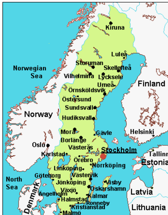
Gráfico 3: Aeropuertos en Suecia