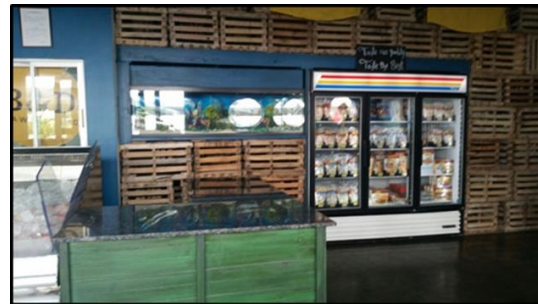
Tienda de B&D Trawling