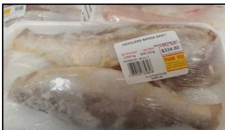
Banga Mary HG Marca: Hi Lo (Bandeja) Precio: US$ 2.6 / 500 gr.