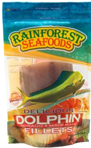
Filetes de Perico