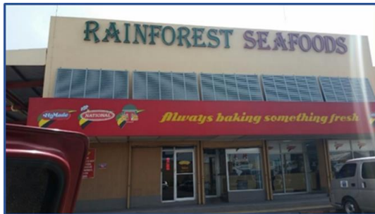
Tienda de Rainforest Seafoods

El canal HORECA jamaicano se encuentra cubierto únicamente por dos principales actores: Rainforest Seafoods y B&D Trawling. En primer lugar, Rainforest Seafood tiene sus propias tiendas de venta de productos de alta calidad. Una es cerca de la planta de Rainforest, las otras dos son en los dos restaurantes Fish Pot. Generalmente los precios son bastante altos. Por otro lado, B&D Trawling también tiene una tienda minorista cerca de su planta, con la venta directa de pescado congelado y fresco al consumidor jamaicano.