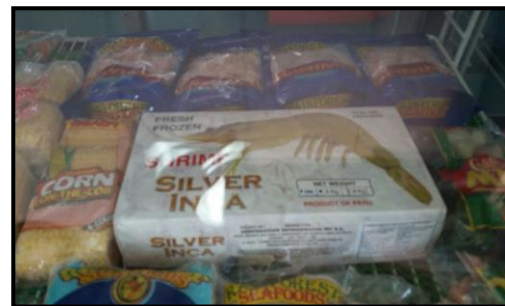
Colas de langostinos crudas congeladas (2,25 kg.) Marca: Silver Inca (Rainforest) Origen: Perú

En lo relativo a conservas de caballa en salsa de tomate y similares, la competencia directa de la oferta exportable peruana en lo relativo a segmento de precio objetivo es Chile, el cual tiene una demanda de poco más de US$ 4 millones para este producto. Se encontró producto chileno en latas tall de 1 lb. de la marca Hi Lo únicamente en salsa de tomate a diferencia de la oferta tailandesa (Grace Kennedy) que presenta mayor variedad.