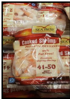
Colas de langostinos cocidas congeladas (453 gr.) Marca: Seabest (B&D Trawling) Origen: Vietnam

En lo relativo a langostino, la única variedad existente en el mercado es el Penaeus vannamei , siendo los principales oferentes India, Ecuador y Vietnam. Vietnam ingresa su producto también a través de la partida de crustáceos procesados. De igual modo que Perú, este país no cuenta con un acuerdo comercial con Jamaica o el CARICOM por lo cual tiene que pagar aranceles de 20% para esta partida. En palabra de la mayoría de compradores, la calidad del producto peruano es superior por lo cual su precio es más elevado que los de origen vietnamita. De hecho, el producto peruano se suele comercializar en cajas ( block frozen ) de más de 2 kg probablemente enfocadas al canal HORECA. Además, aunque Jamaica no cuenta con producción de langostinos, la langosta local puede representar una fuerte competencia directa en lo que se refiere a la restaurantería.