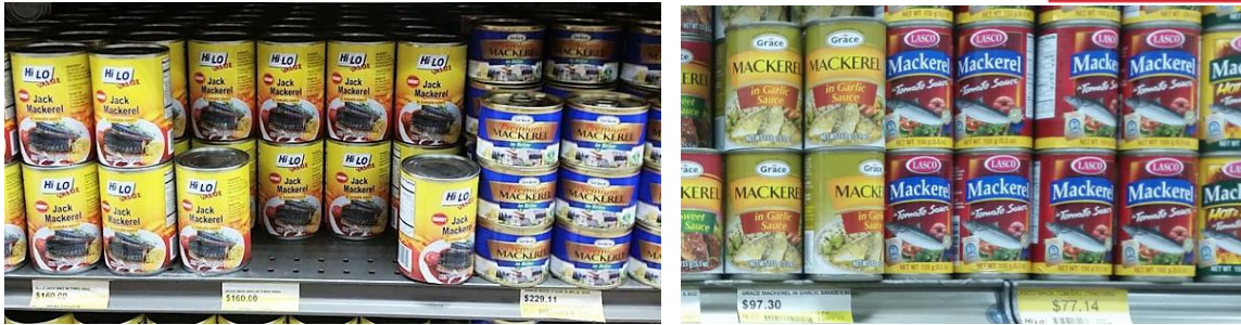
Cuadro N°04: Principales Productos de Pesca CHD Importados por Jamaica