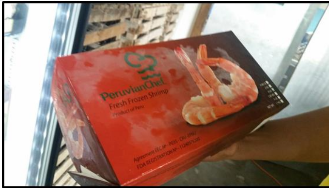
"Peruvian Chef" Rainforest Seafoods – Tienda Propia Precio: US$ 20/ kg.