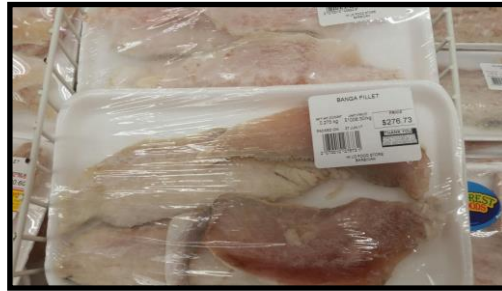
Filetes de Panga

Marca: Rainforest (Bandeja) Origen: Vietnam