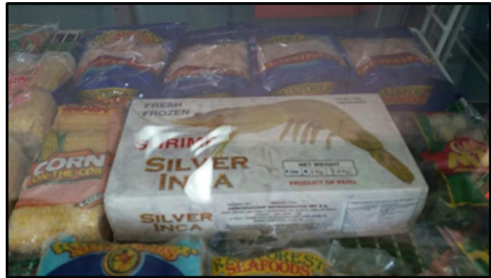
"Silver Inca" B&D Trawling – Tienda Propia