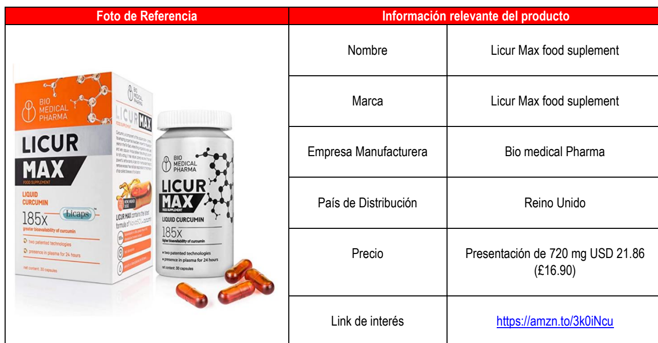
Cuadro N° 10