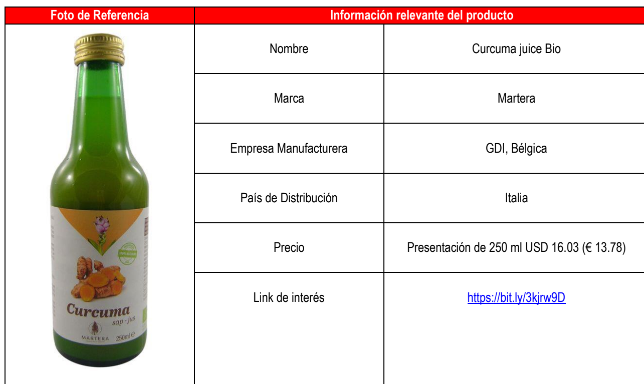
Cuadro N° 11