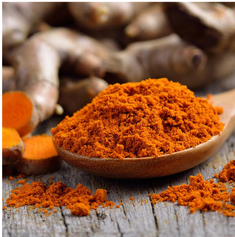
Gráfico N° 1.