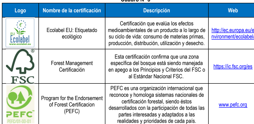
Cuadro N° 3