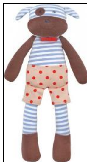
"Boxer Dog" hecho en plush con certificación GOTS, hipalergénico y rellenos con fibra de maíz 100% orgánica Precio: US$ 35 www.organicallybaby.com