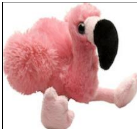
Flamengo en 100% peluche Precio: US$ 7.79 www.wildrepublic.com