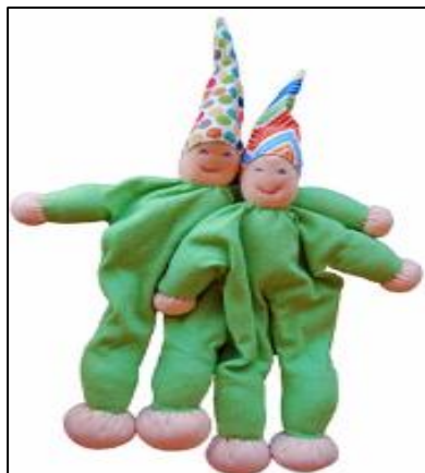
Muñecos estilo "Waldorf", hecho a mano en algodón orgánico Precio: US$ 29.95 www.pureplaykids.com