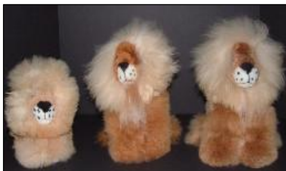
Leoncitos en 100% baby alpaca Precio: US$ 34 www.alpacanation.com