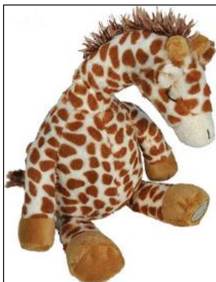
Jirafa en plush, con sonidos especiales para la hora de dormir Precio: US$ 24.99 www.toysrus.com