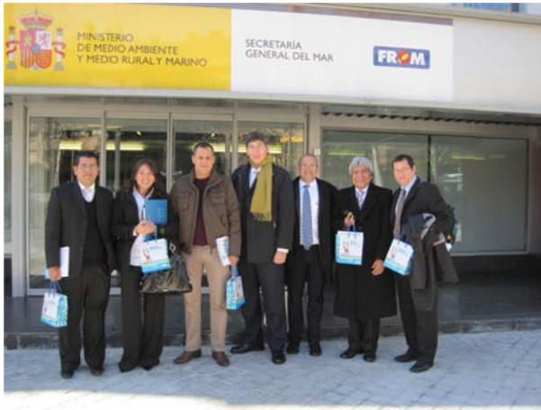
Delegación peruana en visita al FROM, Madrid