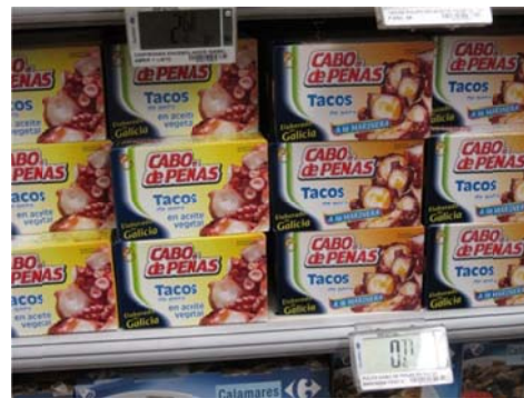
"Tacos de pota", un ejemplo de nueva denominación comercial de los productos importados