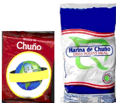
Bolsa de 200 gramos Bolsa x 400 gr.

Para el envasado de fécula de papa se recomienda usar bolsas de polipropileno. El peso será de forma contractual.