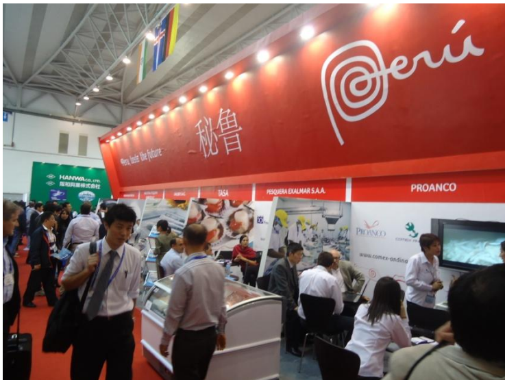
Presentación peruana en China Fisheries 2011