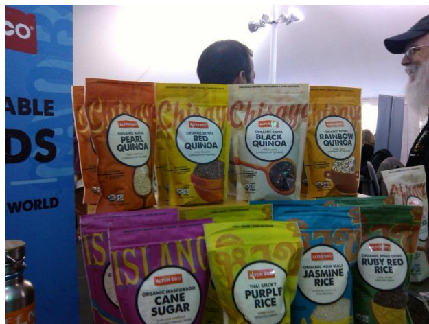
Presentaciones de Quinoa de la empresa Alter Eco. Actualmente se abastecen de Quinoa de Bolivia.

Asimismo predomina la oferta de snacks saludables con frutas deshidratadas, liderando el goji como ingrediente dentro de las mezclas conocidas como trail mixes como se viene observando en otras Ferias especializadas. Esta categoría de productos representa un potencial para el aguaymanto deshidratado, así como otras frutas tales como el mango y la piña.