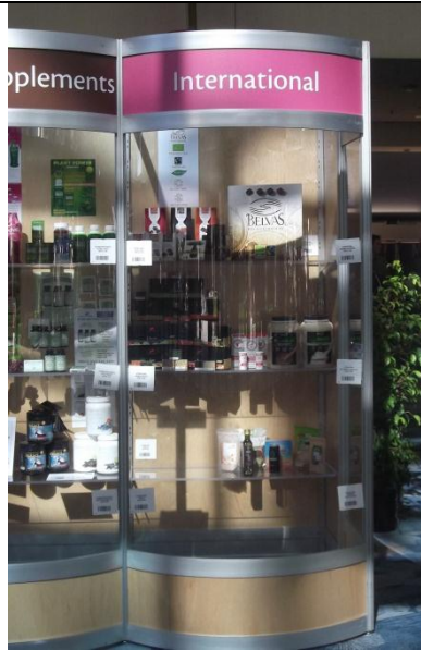
Exhibición en Product Showcase en la sección Internacional / Espacio asignado a Promperú fue el último nivel.