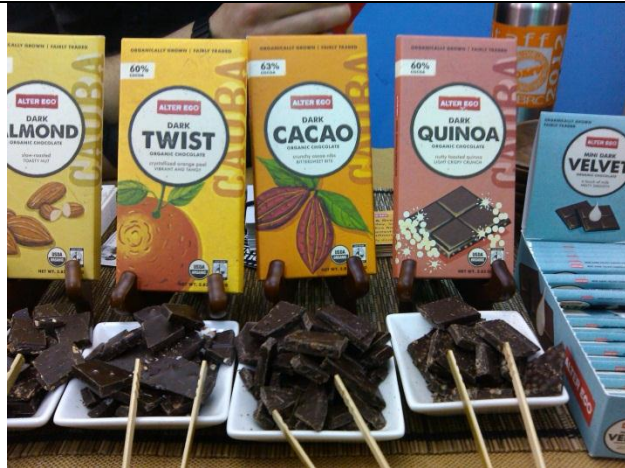
Presentaciones de chocolate de la marca Alter Eco. El cacao proviene de Perú