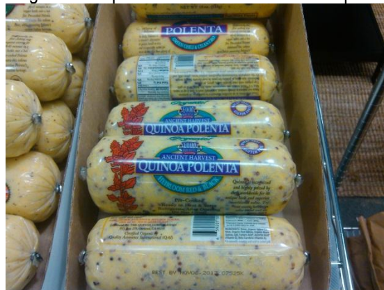
Polenta de quinoa de la empresa Quinoa Corporation

Tanto la chia como la quinoa fueron ingredientes predominantes en los diversos productos presentados durante la feria.