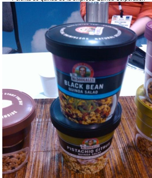
Ensalada de quinoa de la empresa "Dr. McDougall's Right Foods" en formato "Meal on the go"