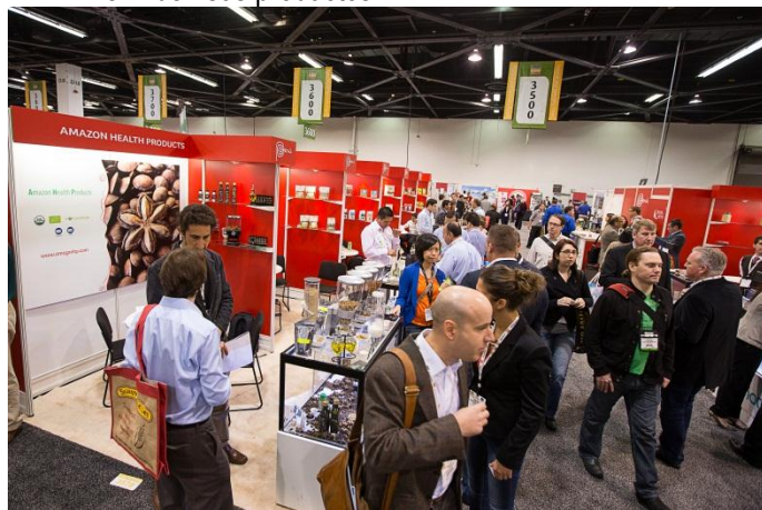
Pabellón Perú en NPEW