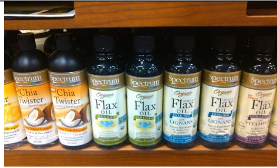
Aceite de Linaza y Chia de la marca Spectrum

Tanto la chia como la quinoa fueron ingredientes predominantes en los diversos productos presentados durante la feria.