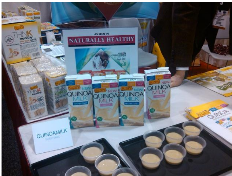
Leche de Quinua de la marca Suzie's perteneciente a la empresa Good Groceries Company