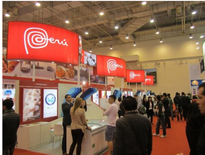
Vistas del pabellón peruano durante la feria 2014