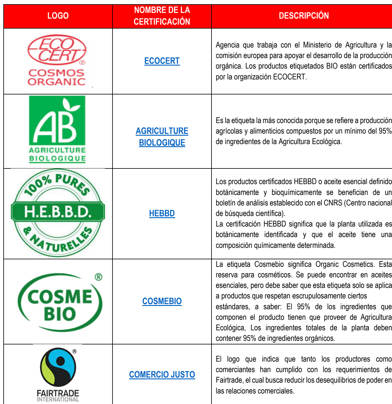
Cuadro N° 2 Certificaciones