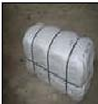
Pprika entero seco en pacas prensadas de pprika entero de 50 o 100 kgs.

El empaque se realiza en pacas de polietileno prensadas con zunchos, de acuerdo como se muestra en el grfico.