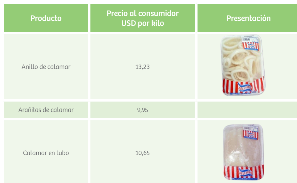
Tabla 15. Precio promedio de productos de mar congelados comercializados en supermercados Panamá