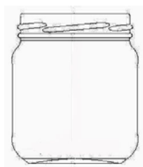
Capacidad de 156 cc.

Sin embargo, de acuerdo a lo solicitado por el comprador, algunas empresas vienen exportando el producto en otras presentaciones, por ejemplo en sachets de 3.4 OZ (100 ml) y en sachets de 0.34 OZ. (10 ml).