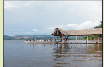
Sauce, destino turístico de la región San Martín y del circuito Nor Amazónico.

El plan de recuperación dinamizará y consolidará la actividad turística en la región San Martín, permitiendo generar una fuente sostenible de ingresos para la población y, al mismo tiempo, proteger el medioambiente y el legado cultural de la zona.