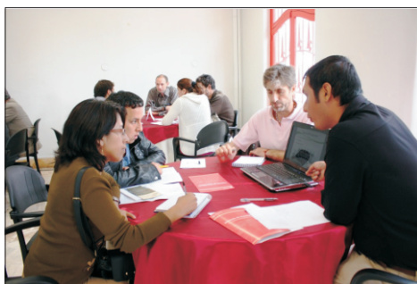
La rueda de encuentros entre investigadores y empresarios.