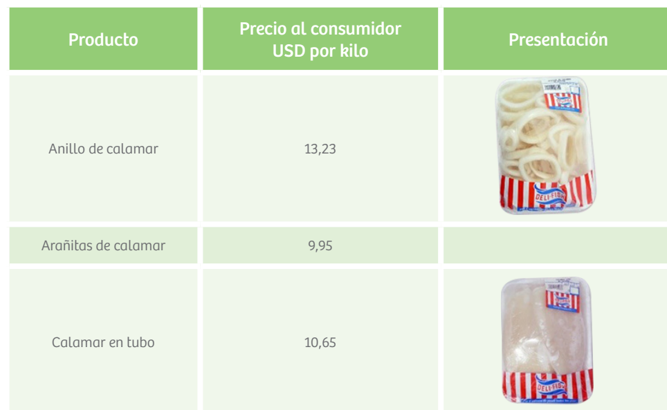
Tabla 15. Precio promedio de productos de mar congelados comercializados en supermercados Panamá