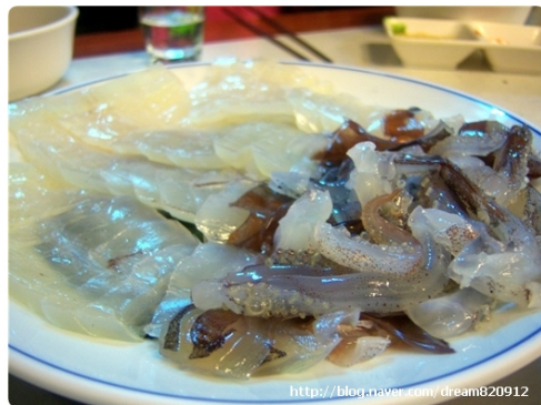
Platos de calamar crudo sazonado con ají picante

Los calamares forman parte de la dieta tradicional coreana y su consumo se extiende a lo largo de todo el año. A los platos tradicionales se han sumado en el último tiempo su uso como insumo para la elaboración de snacks y comida preparada. El consumidor y los servicios de alimentos usan el calamar generalmente para la preparación de platos y sopas. Las formas más corrientes de preparación son: