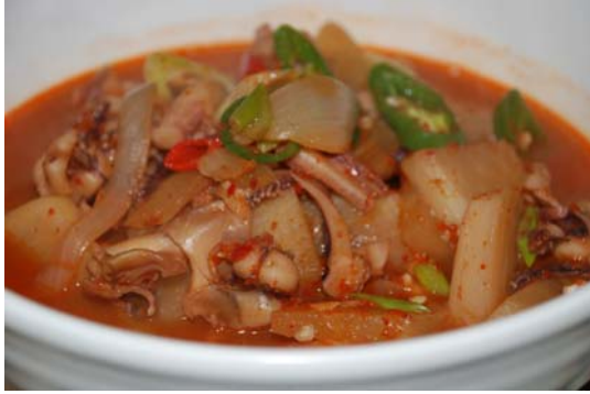
Sopa de calamar con verduras