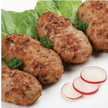
Steak de calamar