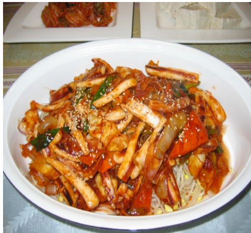
Platos de calamar hervido y condimentado con salsa picante y verduras